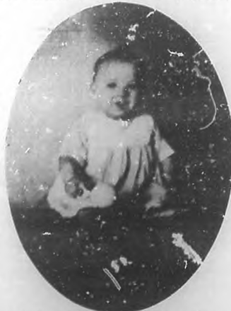
DE CIFUENTES.—"Popito" de la Barca y Tarafa.