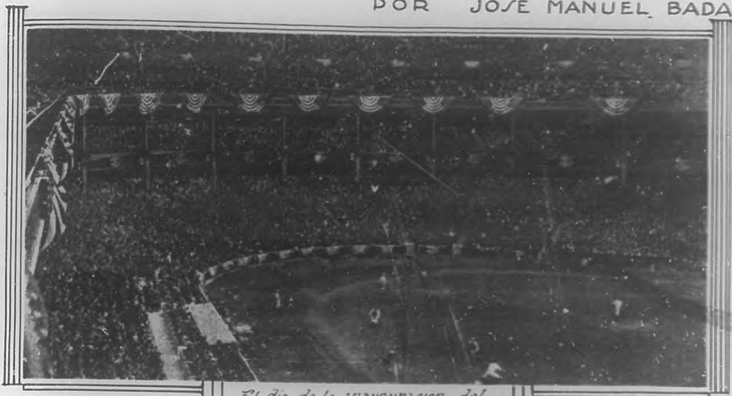
El día de la inauguración del nuevo Stadium "la multitud adorna la victoria de los "Yankees"

Los Estados Unidos es un país de cosas grandes y fantásticas. El pueblo yanqui siente—mejor que ningún otro—la influencia de la noveletaria. Cualquier hecho—por insignificante que sea—adquiere aquí una importancia fabulosa.