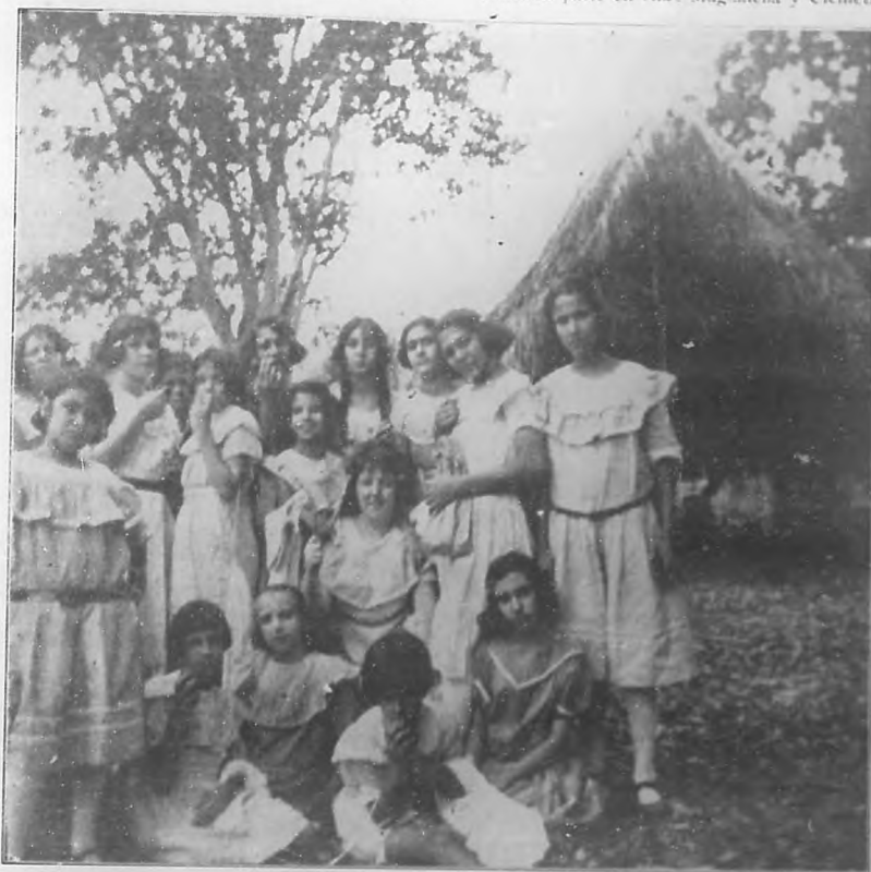
Algunas alumnas del acreditado colegio "María Luisa Dolz", durante el "pic-nic" celebrado recientemente en la hermosa finca "San Miguel" en "El Lucero".