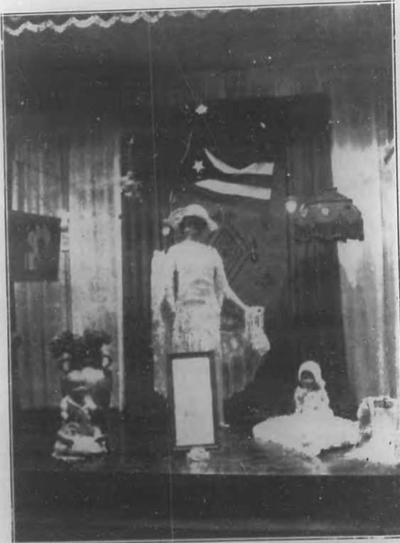
Una de las vidrieras de "El Encanto", donde se exhiben algunos trabajos del Concurso de Tejido.

Pasó algún tiempo, hasta que una mañana la Sra. Arza se acercó a nuestra mesa diciéndonos alborozada: "Acabo de recibir el primer trabajo para el Concurso". Era un trabajo sencillo, modesto, pero tenía el mérito insuperable de ser el primero, de ser el que venía a fortalecer la fe de la iniciadora del Concurso en el éxito final del mismo. Al día siguiente se recibieron dos y al otro, cinco. Y así, cada día aumentaba el número de trabajos recibidos y lo que es digno de mención: cada vez era mayor el mérito de ellos. El éxito del concurso estaba asegurado no solamente