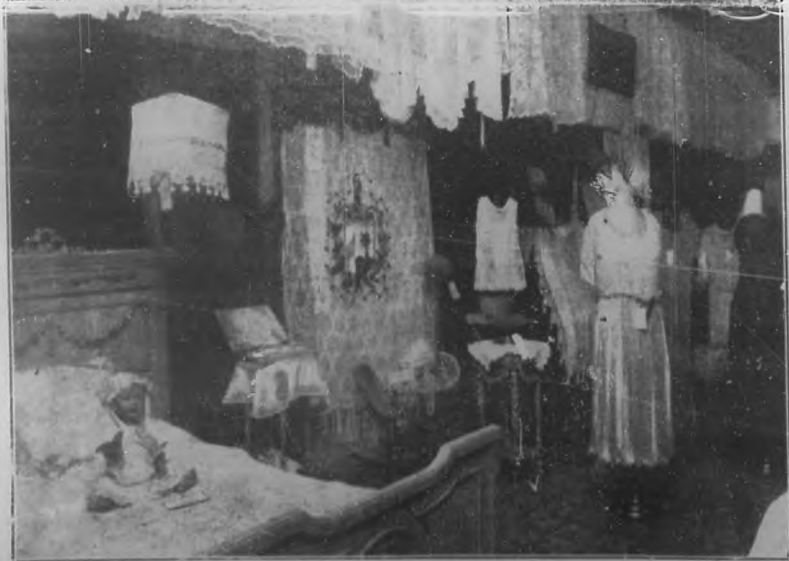
Parte de la gran exposición del Concurso de Tejido, en el salón del primer piso de "El Encanto". Sólo se ve una esquina.

te en lo relativo a la cantidad de trabajos enviados sino también al mérito de los mismos. Entre los centenares de obras recibidas, más de la mitad estaban confeccionadas con singular habilidad y exquisito gusto.